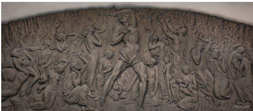
rasm. “Buyuk ipak yo‘li” metro bezakidagi barelef

“Kosmonavtlar” metro bekatining yulduzlar mavzusidagi kompozitsiyasi: Me’moriy bezaklari Kosmonavtika mavzusiga bag‘ishlangan. Ichidagi ko‘k sopol Mirzo Ulug‘bek tasvirlari bilan bezatilgan, Undan tashqari, Ona yer, Valentina Tereshkova , Yuriy Gagarin , Vladimir Jonibekov va hokazo kosmonavlarning suratlari bor. Juda mayda shisha yulduzlar bilan bezatilgan shift, somon yo‘lini eslatadi. 2019-yil 22-noyabr kungi Amerikaning “New York Times” gazetasi Toshkent metrosiga bag‘ishlangan rangli fotosessiyasida “Toshkent, O‘zbekiston poytaxti - bu dunyodagi eng chiroyli bezatilgan metro liniyalaridan biriga ega bo‘lgan shahar”- deb e’tirof etdi. 29 ta bekatining aksariyati mozaikalar va bareleflar bilan bezatilgan.