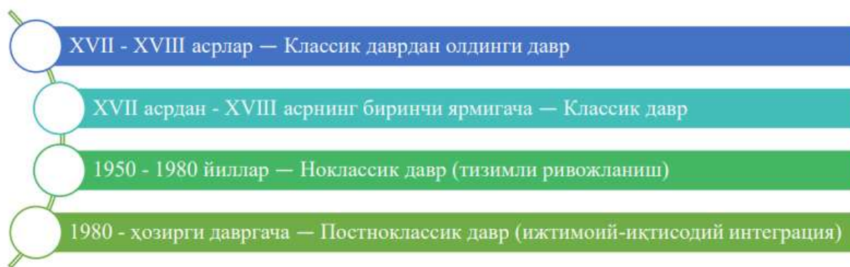
1-расм. Техника ва банкнинг ривожланиш давларининг ўзаро боғлиқлиги

Аммо, тарих ва илмий тадқиқотлар шуни кўрсатадики, банк технологиялари банк пайдо бўлган илк даврлардан бошлаб содда кўринишда (шаклда) бўлсада мавжуд бўлган. Буни технологик тараққиёт босқичлари даври ва банкларнинг ривожланиш давлари билан уйғунликда қуйидагича ривожланиш иерархиясини изоҳлаш мумкин (1-расм).