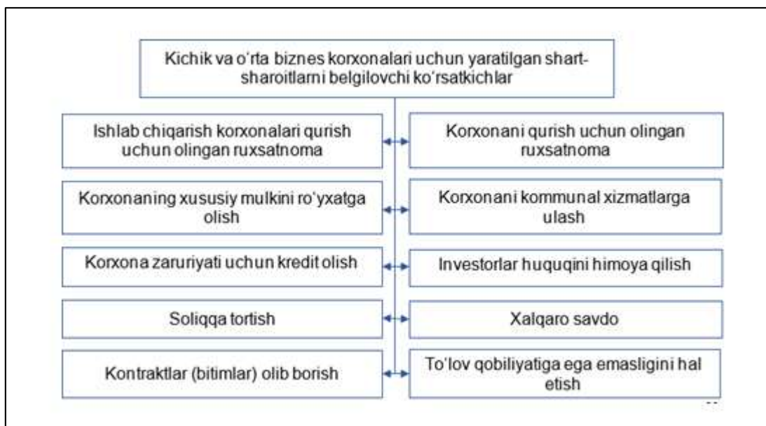
2-rasm: Kichik va o'rta biznesni rivojlantirish shart-sharoitlari.