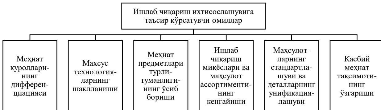
2-расм. Ишлаб чиқариш ихтисослашувига таъсир кўрсатувчи омиллар 8 .

чиқариш ихтисослашувига таъсир кўрсатувчи омилларни куйидаги расм орқали ифодалаш мумкин (3-расм).