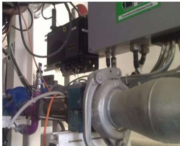
7-rasm – Radio model. (Tashkent-2018)

Lazer to'liq stansiyasi orqaga qarash nuqtasiga (prizma) nisbatan oriyentatsiyalanganidan so'ng reflektor), butun stansiya avtomatik ravishda ichkariga o'rnatilgan lazer nishoniga yo'naltiriladi qalqon, nishondan kelayotgan signallar lazer stansiyasi orqali uzatiladi. Radio modemning boshqaruv pultidagi sanoat kompyuteriga kanallari umumiy lazer stansiyasi nuqtalarda gorizont va gorizont burchaklarni o'lchaydi, shuningdek masofa, u yerda ushbu o'lchovlar ma'lumotlari monitorda ko'rsatiladi grafik va raqamli formatda. Tunis (Tunnel va yer osti integratsiyalashgan