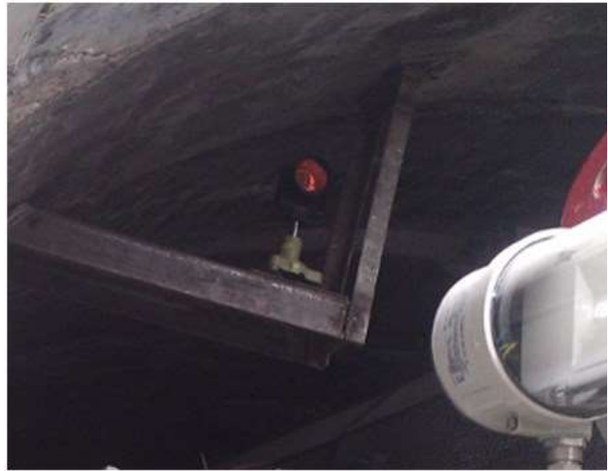
5-rasm – prizma-konsolda reflektori (Tashkent-2018)