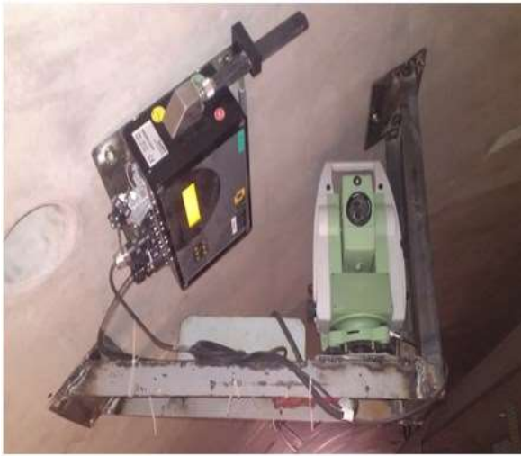
4-rasm – yarim robot lazer umumiy stansiyasi va radio modem(ko'chma).(Tashkent-2018)