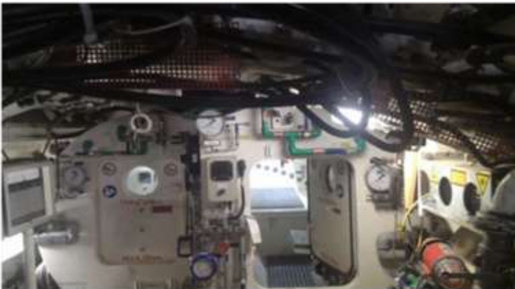
2-rasm - Shlyuzli shchit kamerasi (Toshkent-2018)

Yer osti yo‘li eng aniq navigatsiya elektronikasi yordamida quriladi; uning yordamida qalqon syomkachisi yo‘lning loyiha koordinatlarini reja va profil bo‘yicha tekshiradi. Tunnel qurilgandan so‘ng, tunnellashtirish uskunalari boshqa yer osti liniyalarini qurish uchun ishlatiladi. Qalqonlar asosan tuproq quyuqligini bo‘tqadan yumshoqqacha bo‘lgan tuproqlar uchun qo‘llaniladi. Ishchi organ yordamida qazib olingan jins o‘zi yuk tashish muhiti vazifasini bajaradi. Tuproqqa konditsionerlar qo‘shilganda u “bo‘tqa”ga aylanadi va zaboyning old qismini ushlab turish uchun ishlatiladi. Shnek zaboyning old qismidan orqaga yo‘naltirilgan tuproqni qabul qiladi. Shnekdan qazib olingan jins konveyer tasmasiga tushadi va u orqali transport aravachalarining yuklash stansiyasiga yetkaziladi.