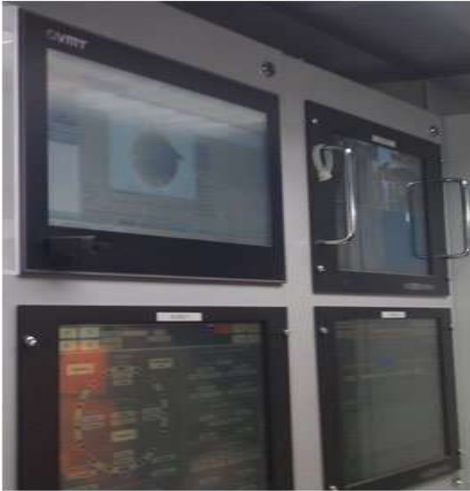
8 – rasm.Sanoat kompyuteri “VMT” (Tashkent-2018)

dasturiy ta'minoti) ma'lumotlarni tayyorlash va tahlil qilish uchun integratsiyalashgan dasturiy platform metropoliten qurilishi loyihalari [2]