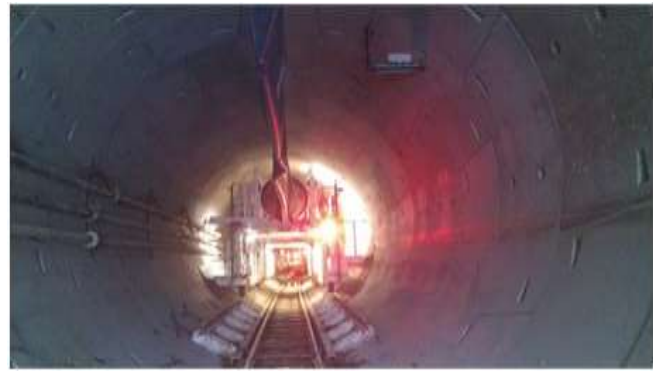
3-rasm - Texnologik himoya aravachasining oxiri (Toshkent-2018)