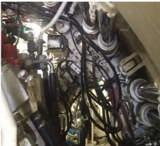
6-rasm – faol lazer nishoni. (Tashkent-2018)