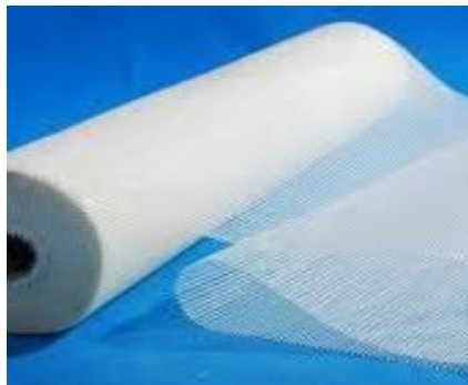
3-rasm. Shisha tolali matolar