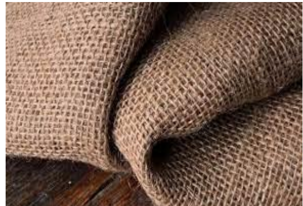
1-rasm. Nitron tolali matolar.

3) Lavsanli (termoplastik tolalar yoki polietilentereftalat (PET) neftdan olinadi) matolardan esa sement, metallurgiya va ximiya sanoatida issiq va quruq gazlarni tozalashda foydalanilmoqda.