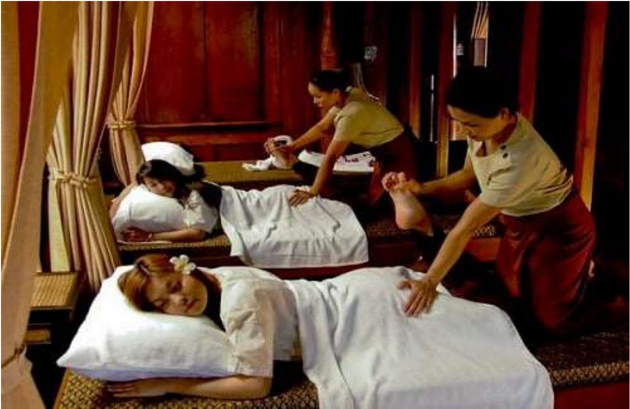
1-rasm. Hindistonda “Ayurveda” davolash usuli

Ayniqsa, o‘rta asrlarda G‘arbiy Yevropa jamiyatida cherkovning ustuvorligi sababli alternativ tibbiyotning ayrim shakllari (masalan, xalq tabobati, shamanizm, sehrgarlik) bid‘at va irtido deb baholangan. Bunday yondashuvlar ko‘pincha ijtimoiy repressiyaga uchragan, shifokorlar va tabiblar esa jismoniy jazoga tortilgan. Biroq, Islom sivilizatsiyasida Ibn Sino, Ar-Roziy kabi olimlar tomonidan xalq tabobati bilan ilmiy tibbiyot o‘rtasidagi integratsiya yo‘llari ishlab chiqilgan. Bu esa alternativ yondashuvlarning jamiyatdagi ijtimoiy mavqeiga ijobiy ta’sir ko‘rsatgan.