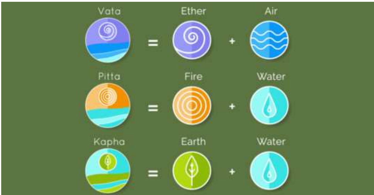
2-rasm. Vata, Pitta, Kapha nomli 3 ta bioenergetik kuchlar

o‘zining diniy, falsafiy va tabiatshunoslik asoslariga tayanib, sog‘lom turmush tarzini rag‘batlantirgan. Tadqiqotda aniqlanishicha, Hindistonda hozirgi kunda ham aholining qariyb 70 foizi Ayurvedaga asoslangan alternativ tibbiyotni ishonchli deb hisoblaydi. Bu esa uning faqat tarixiy emas, balki zamonaviy ijtimoiy konstruksiya sifatida ham dolzarbligini tasdiqlaydi (2-rasm).