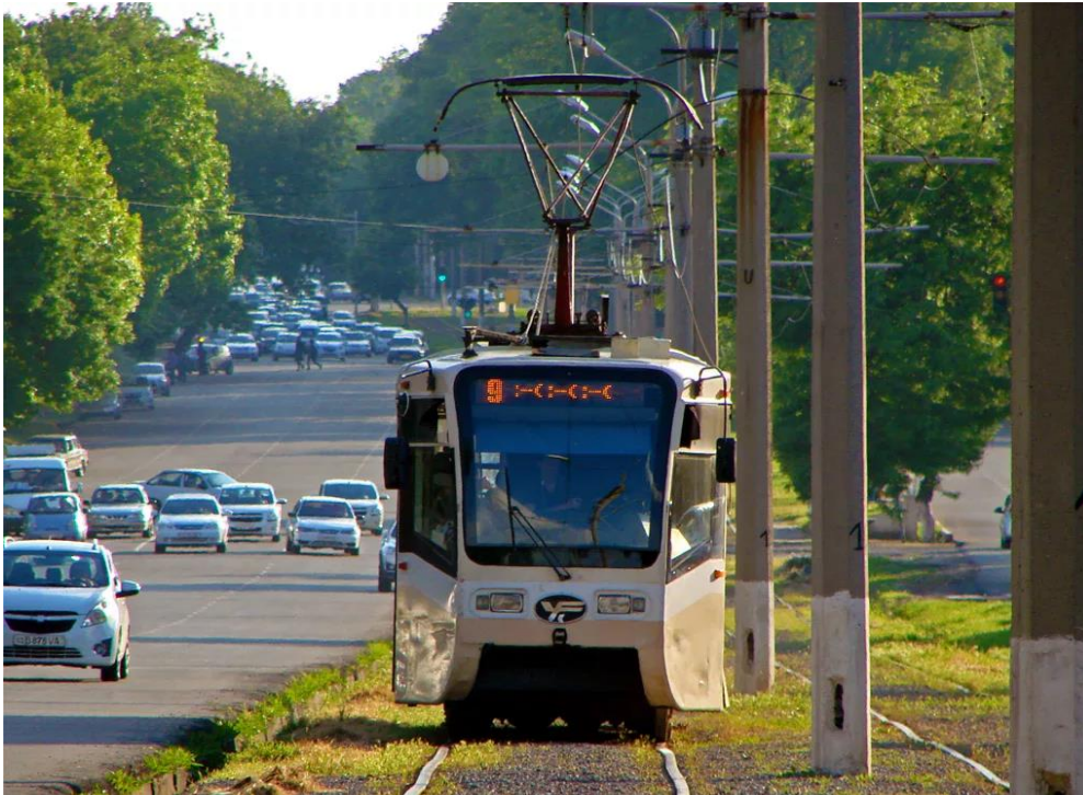
2-rasm. Toshkent, 2016-yil.

Transport tizimlarining muvofiqligi shahar yo‘l harakati tizimining optimal ishlashining asosiy sharti hisoblanadi. Turli omillarga (geografik joylashuv, tarixiy sharoitlar, joy reliefi va shaharning rivojlanish darajasi) qarab, rivojlangan jamoat transportiga ega shaharlarda bir vaqtning o‘zida bir nechta transport subtizimlari mavjud bo‘ladi. Transport rejalashtirish - transportga bo‘lgan talabning o‘shishini qondirish uchun transport tizimi quvvatlarini uzluksiz oshirish zarurati bilan belgilanadi. Transport rejalashtiruvchilari va menejerlari e‘tiborini nafaqat zarur transport infratuzilmasini oldindan ko‘rish va ta‘minlashga, balki transport xizmati foydalanuvchilarining talablarini ustuvorligini tan olgan holda ulardan maksimal darajada foydalanishga qaratishlari lozim.