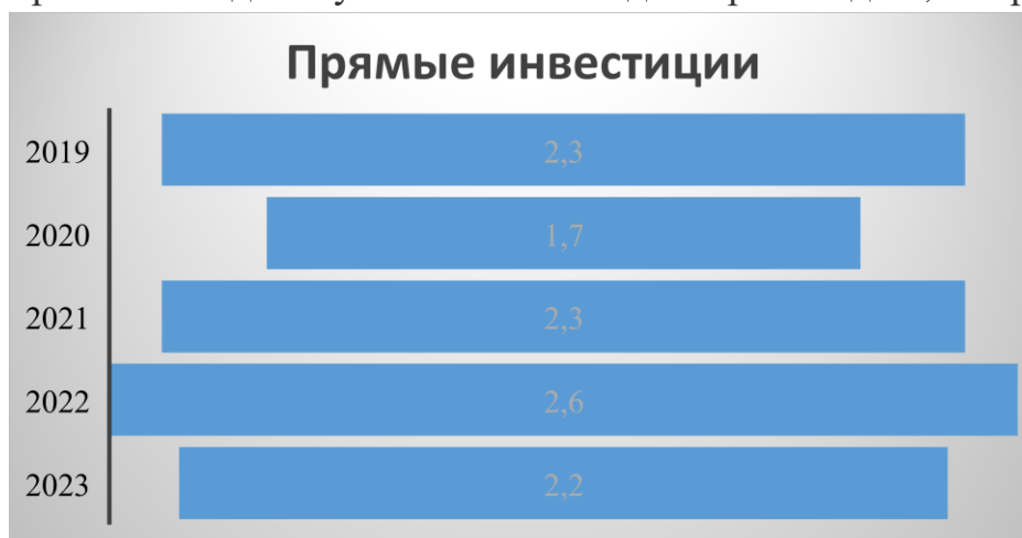
Диаграмма 1. Прямые инвестиции в экономику Республики Узбекистан за 2018-2023 гг.

Если рассматривать итоговые показатели 2023 года, то по данным Центробанка, объём прямых иностранных инвестиций (ПИИ) в экономику Узбекистана в 2023 году достиг $7,2 млрд , что вдвое больше, чем в 2022 году. Львиная доля зарубежных вложений пришлась на IV-й квартал прошлого года — $3,4 млрд . Объём денежных переводов вернулся к среднесрочному трендовому уровню до $11,2 млрд . К концу прошлого года Узбекистан привлёк международные кредиты на $2,8 млрд . В частности, Азиатский банк развития выделил Узбекистану $615,6 млн , Всемирный банк — $552,4 млн , Китайская Народная Республика — $398,8 млн . По итогам прошлого года общая сумма денежных поступлений в банки Узбекистана составила 669 трлн сумов , что на 28% больше по сравнению с 2022 годом. Если в 2021 году чистый приток прямых инвестиций в страну составил 2,3 млрд долларов, а в 2022 году он вырос до 2,6 млрд долларов, то по итогам прошлого года он упал на 425 млн долларов — до 2,2 млрд долларов (-16%).